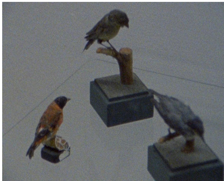
← Salvatore Arancio, Birds , video still da proiezione, 2012, Galleria Federica Schiavo, Roma

Salvatore Arancio è nato a Catania nel 1974. Vive e lavora a Londra. Ha studiato fotografia al Royal College of Art di Londra. È stato uno dei vincitori dell'Elephant Trust Grant, Londra nel 2011; vincitore del Premio 'New York' nel 2009 ed è stato selezionato per Bloomberg New Contemporaries, Londra nel 2006.