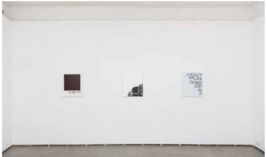
Todd Norsten The Heart Of Everything That Is | Room 1, 2016 Installation view 8#8232; Photo by Giorgio Benni

L'apparente casualità delle parole, la calligrafia trascurata e l'effetto sporco, quasi rudimentale, nascondono un raffinato lavoro di trompe l'oeil che si dequalifica apparentemente nell'effetto "trasandato", ricercato al fine di rendere visibile sul supporto un mondo di parole urtanti ed affilate, lette quasi per caso, come dal finestrino di un'auto in corsa.